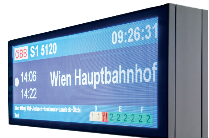
Examples from the Funkwerk hardware range Beispiele aus dem Funkwerk Hardwareportfolio